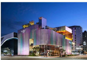
포스코 더샵갤러리 2.0