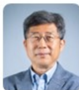
박광재 한국주거학회 회장